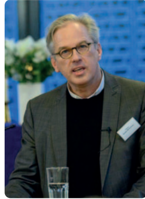
Kirchenpräsident Karsten Wolkenhauer

seitige „linke“ Positionierungen vor. Staatsleistungen, die die Bundesländer verfassungsgemäß als Ausgleich für Enteignungen im 19. Jahrhundert zahlen, sollen künftig an Bedingungen geknüpft werden.