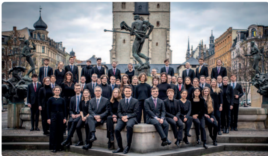
Auch der Chor der Kirchenmusikhochschule ist im Jubiläumsjahr aktiv.

Hochschule verliehen. Sie ist nach eigenen Angaben die älteste und größte Hochschule für Kirchenmusik in freier Trägerschaft in Deutschland.