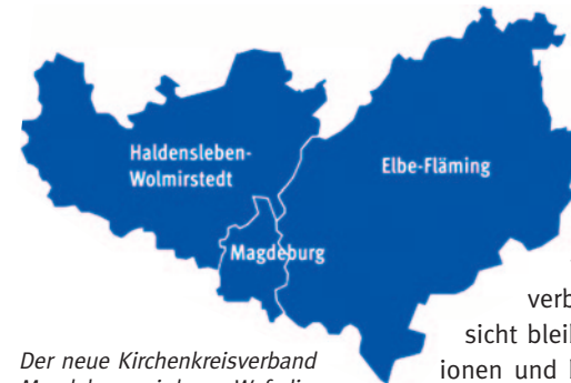
Der neue Kirchenkreisverband Magdeburg wird von Weferlingen an der Grenze zu Niedersachsen bis nach Ziesar in Brandenburg reichen.

Nun ist es kein Geheimnis, dass die Gemeindeglieder über die Jahre signifikant weniger werden. So betrug die Mitgliederzahl in den drei Kirchenkreisen im Jahr 2015 noch gut 50.000. Aktuell sind es noch 37.000 Menschen und für das Jahr 2034 geht die Prognose von 25.700 Gemeindegliedern aus. Dementsprechend sinken auch die Stellen im Verkündigungsdienst. Von 74 Stellen im Jahr 2015 für die drei Kirchenkreise sank die Zahl auf 55 Stellen im Jahr 2026. Da die Kirchengebäude und auch andere Aufgaben nicht im gleichen Maß sinken, müssen die Lasten von weniger Schultern getragen werden. Nach vielen Änderungen in den Strukturen der Kirche seit 1989 sind die nächsten Schritte notwendig, um die Kirche im Dorf und in der