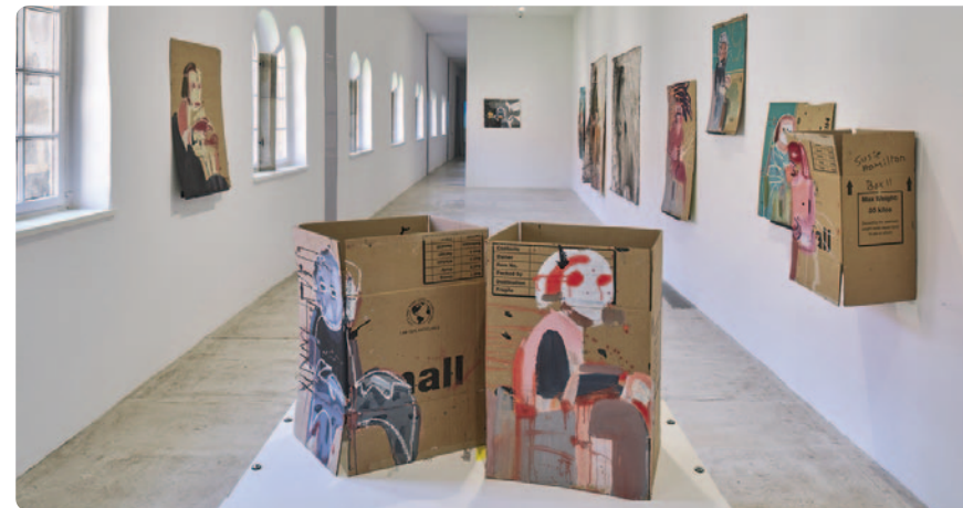
Susie Hamilton, Arbeiten aus der Serie „Underground“, 2023/2025

Sonderausstellung ist noch bis zum 6. September im Kunstmuseum Magdeburg zu sehen